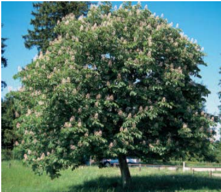
Die Roßkastanie ( Aesculus hippocastaneum )

Fam.: Hippocastaneae - Roßkastanien- gewächse